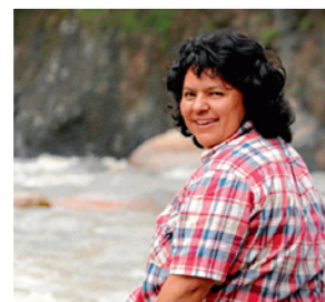
Η ΟΝΔΟΥΡΙΑΝΗ ΑΚΤΙΒΙΣΤΡΙΑ ΤΟΥ ΠΕΡΙΒΑΛΛΟΝΤΟΣ BERTA CÁCERES ΔΟΛΟΦΟΝΗΘΗΚΕ ΤΟΝ ΜΑΡΤΙΟ ΤΟΥ 2016

ΑΠΟ ΤΟ 2009 Ο ΑΡΙΘΜΟΣ ΤΩΝ ΔΟΛΟΦΟΝΗΜΕΝΩΝ ΠΕΡΙΒΑΛΛΟΝΤΙΣΤΩΝ ΕΧΕΙ ΑΥΞΗΘΕΙ ΑΠΟ 1 ΣΕ 4 ΑΝΑ ΕΒΔΟΜΑΔΑ