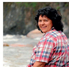
HONDURŠKA OKOLJEVARSTVENICA BERTA CÁCERES JE BILA UMORJENA MARCA 2016.

OD LETA 2009 SE JE ŠTEVILO UMORJENIH OKOLJEVARSTVENIKOV POVEČALO Z 1 NA 4 NA TEDEN.