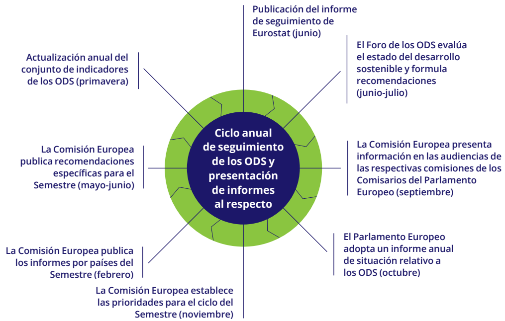
Figura 3: Ciclo de seguimiento anual propuesto para la UE